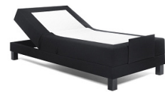
Boxspring (box met springveren)