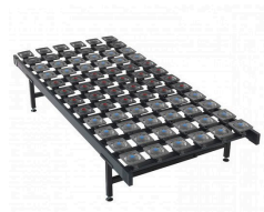
Schotel bodem (bodem opgedeeld in kleine vierkante schotels)