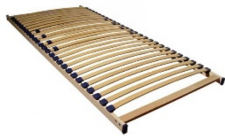
Lattenbodem (houten of plastic latten)